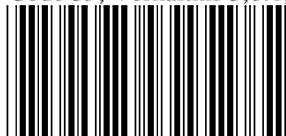
Code 39, Verhältnis 3,0:1, ohne Prüfziffer